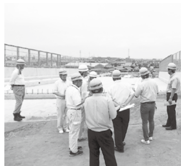
郷松の端線建設現場

し、郷松の端線の道路整備状況と、角野船木線と種子川筋線の交差点予定地付近の状況について現地調査を行いました。