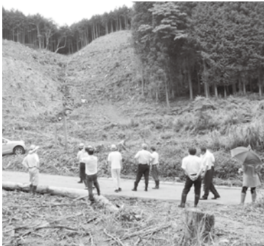
サトウカエデ栽培予定地

8月7日(木)に委員会を開催し、安全・安心・安定した飲料水供給を行うため整備中の別子山区飲料水供給施設と、メープルシロップを採取するためのサトウカエデ栽培予定地(別子山)の現地調査を行いました。