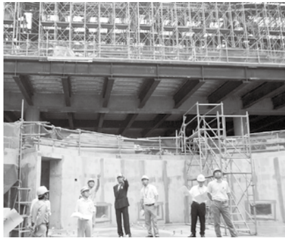
総合文化施設建設現場

8月8日(金)に委員会を開催し、継続審査となっている請願第5号(集団的自衛権行使を容認する解釈改憲を行わないことを求める意見書の提出方について)の審査と、平成27年春に開設の現地調査を行いました。