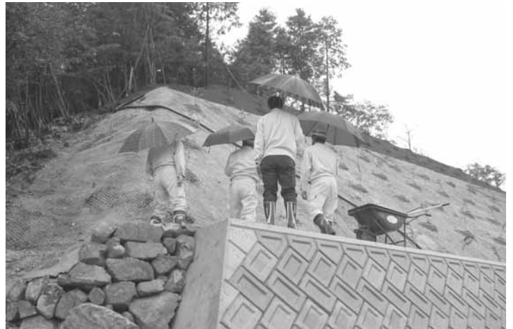
工事監査における現地調査の様子