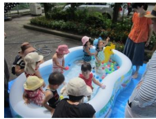
7/13のプール遊びの様子