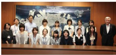
平成25年6月 委嘱式が行われ活動スタート!

私たち8期生は、働くうえでも私生活でも大切なコミュニケーションを中心に学んできました。さらに2年目は「女性リーダー像を探る!!」をテーマに、ロールモデルインタビューにも取り組み、公開定例会や活動発表会を開催しました。