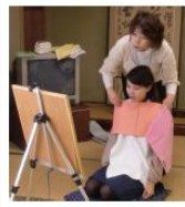
美を添える講座 カラーコーディネート