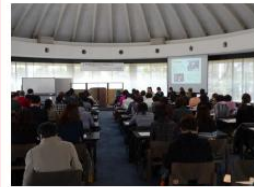
男女共同参画推進事業所研修会にて「女性リーダー像を探る!!」活動発表