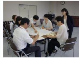
「女性リーダー像を探る!!」をテーマに公開定例会を開催