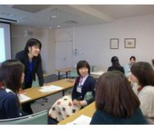
わたしもまわりも幸せになる～タイムマネジメントは難しくない～