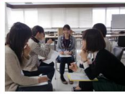
働く女性のコミュニケーションスキルアップ講座