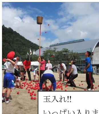
玉入れ!! いっぱい入りました