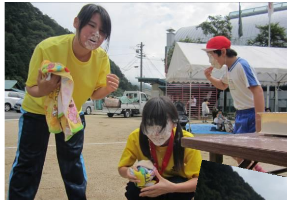
障害物競争・お口でマシュマロキャッチ!! 「色白のかわいいお顔」?