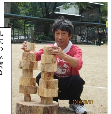
丸太積み競争・ 目線をいただきました