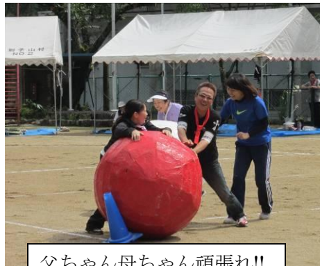
父ちゃん母ちゃん頑張れ!! 大玉の行方は・・・?

皆さんのおかげで、ケガもなく素晴らしい運動会となりました。本当にありがとうございました。