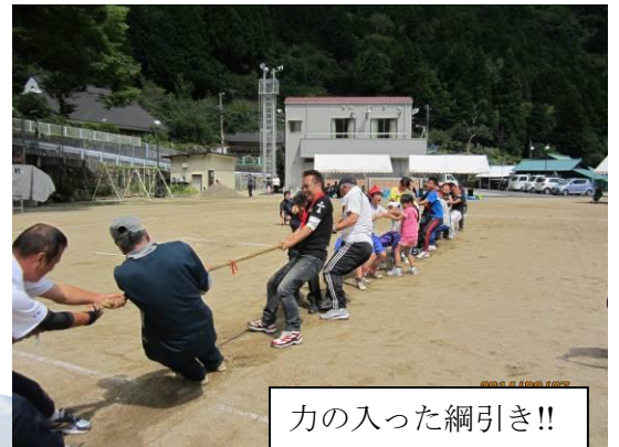
力が入った綱引き!!