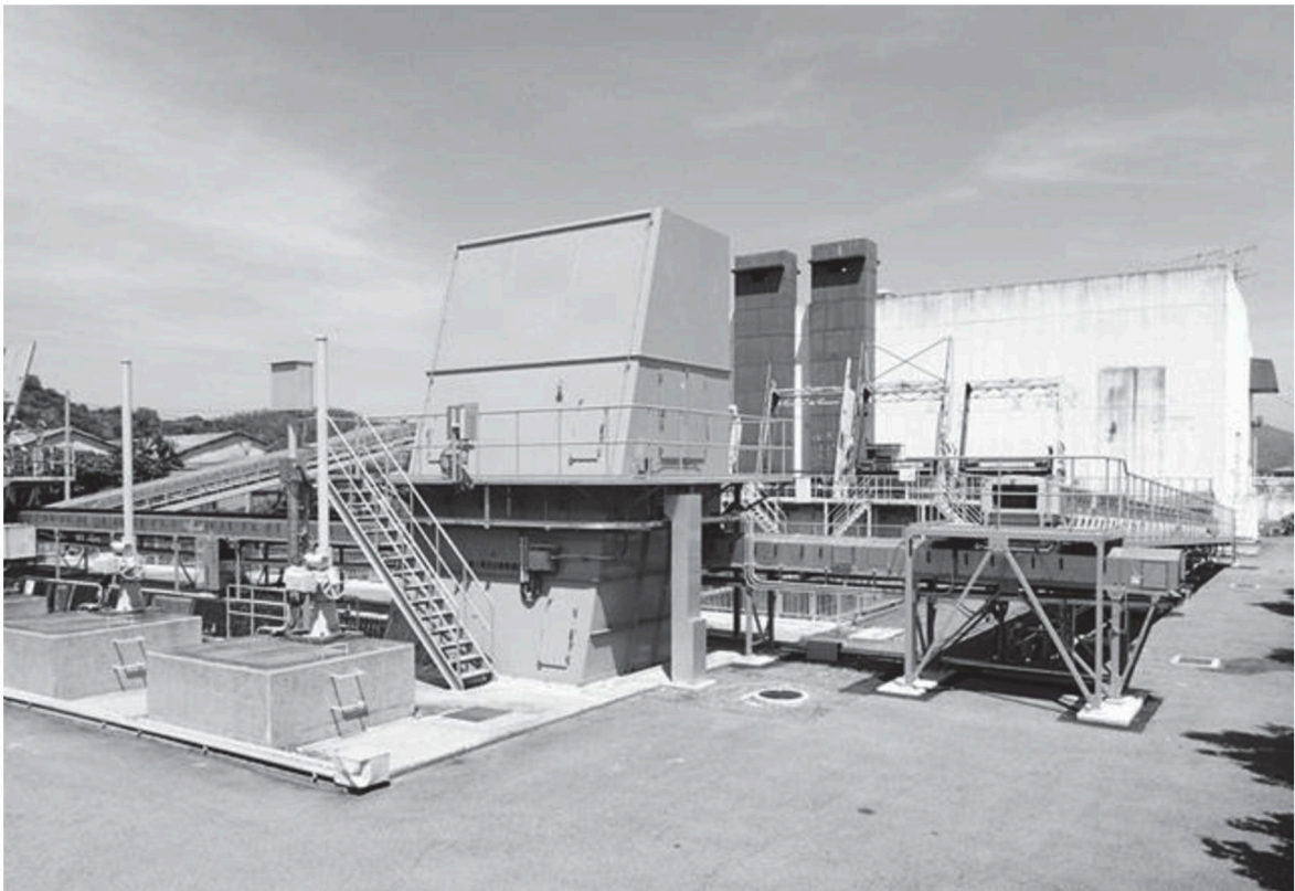
江の口雨水ポンプ場