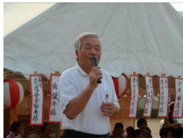
石川市長が来場!! 挨拶のあとは、夏まつりを大いに楽しんで頂きました。

8月15日(月)、恒例の「船木ふるさと夏まつり」が船木小学校グラウンドで開催されました。帰省した人と久しぶりに会ったり、バザーのうどんやかき氷を食べたり、子供たちは大人太鼓台を引きご褒美のお菓子を貰ったりし、思い思いの楽しい時間を満喫しました。