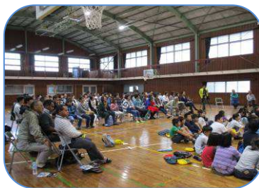
海外の方も立派な発表に感心！