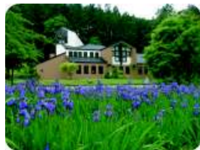
住友林業 フォレスターハウス (休み=月火曜日・12-2月)