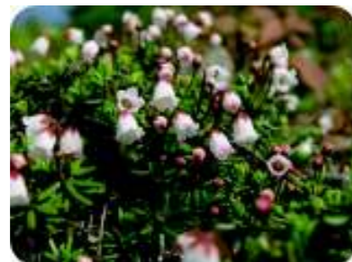
ツガザクラ (5月中旬)