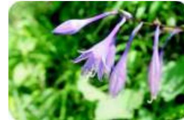
シコクギボウシ (7月上旬)