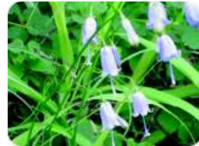
オトメジャシン (8月上旬) 東赤石山固有種