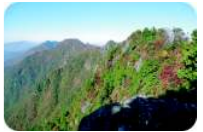
ニツ岳よりエビラ山方面