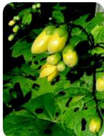
キレンゲショウマ (7/下~8/上)