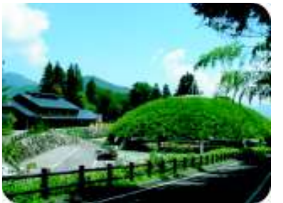
ゆらぎの森 (定休日=水曜日)