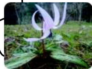
カタクリの花 (4/中~5/上)