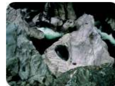
保土野の罅穴 新居浜市指定天然記念物