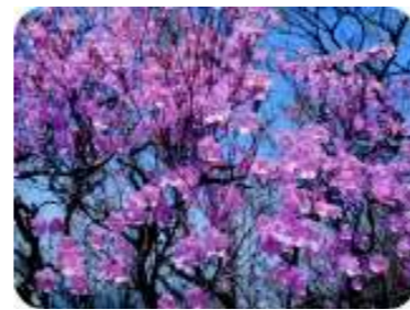
アケボノツツジ (5月中旬)