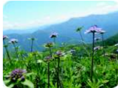
タカネマツムシソウ (7月下旬)