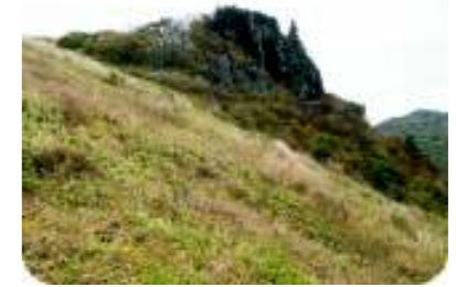
権現岩 (エクロジャイト)