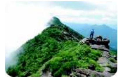
東赤石山とカンラン岩