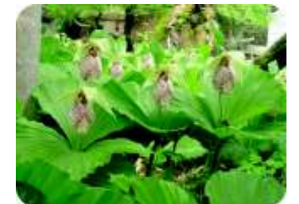
クマガイソウ (4月下旬)