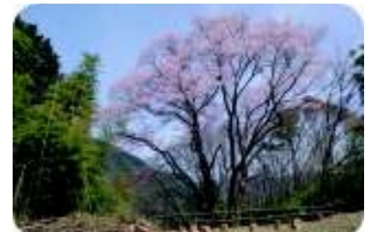
エドヒガンザクラ (4月中旬) 新居浜市指定天然記念物