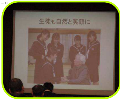
生徒と高齢者のふれあい

プログラムにおいて、新居浜市社会福祉協議会や見守り推進委員の方と連携した学びの様子を社会福祉協議会の方とともに紹介してくれました。中学生が地域の独居高齢者を訪問する体験を通して、「地域の支え合いの大切さ」を実感したり、中学生として「地域に何ができるかを考え発信する力」を身に付けたりする様子が報告され、来場されていた地域の方や福祉関係者も大変感心されておりました。