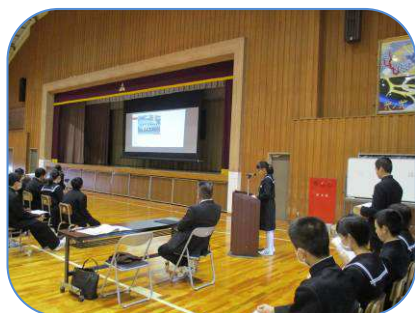
新リーダーが堂々と発表

大森第六中学校とは、来年度以降もこの貴重な「かかわり」をつないでいけるよう、教育委員会として支援してまいります。