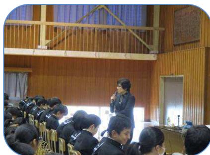
柴崎先生による出前授業