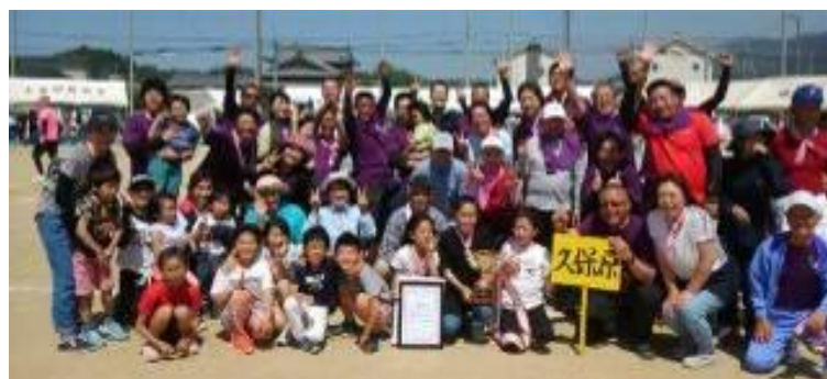
10年ぶりの優勝に沸く久保原のみなさん。おめでとうございます!

3 準優 優 優 位 勝 勝 : : : : : : 元 谷 久 船 前 保 木 原