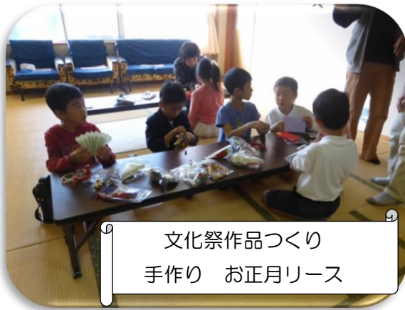
文化祭作品づくり 手作り お正月リース