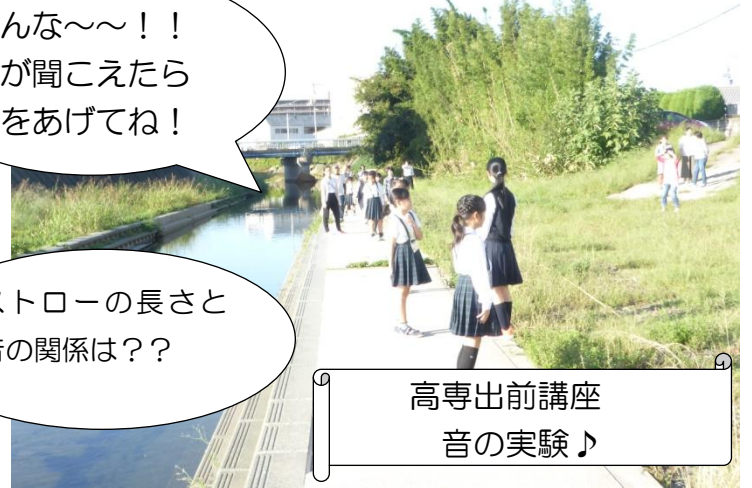
高専出前講座 音の実験♪