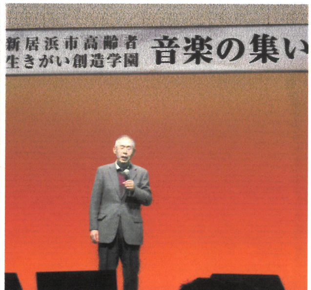
あかがねミュージアムでの第一回「音楽の集い」の一風景