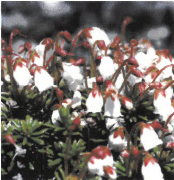
銅山峰の春を彩るツガザクラ