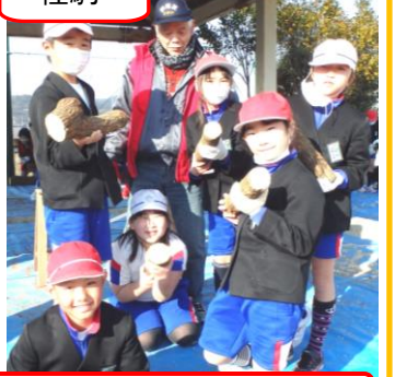
おいしいしいたけできるかな