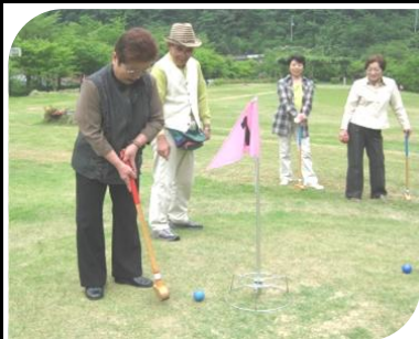
様子様 子や子 智ミ昭歌 美藤下和 田藤近 岡齊丹 第1位 岡齊丹 第2位 田藤近 第3位 美藤下和 第B賞 子や子

マイントピアにて開催しました。皆さん初挑戦ながらも、素晴らしい腕前を披露して下さいました。