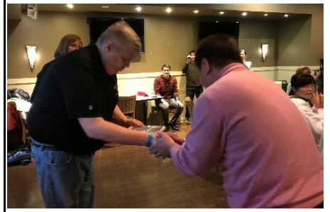
「ケニア先生ありがとう！」