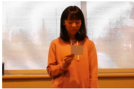
生徒代表お礼の英語スピーチ