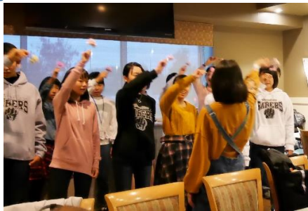
歌発表「♪世界に一つだけの花」