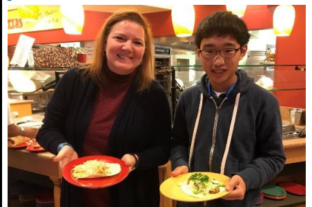
パートナーママと！