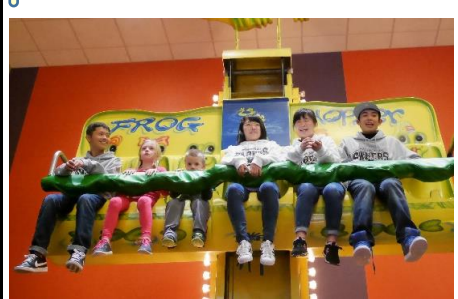
地域の子どもたちと！