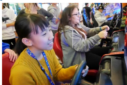
パートナーとの息ぴったり