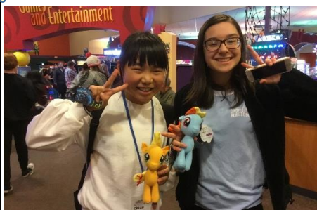
おそろいをゲット！