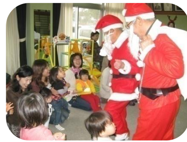
12/21クリスマス会の様子