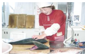
お魚料理教室の様子です。