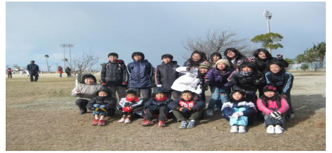
6年2組の皆さんです。