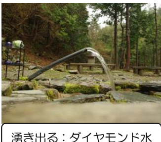
湧き出る：ダイヤモンド水