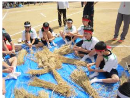
「なわなない競争」形になってます!!