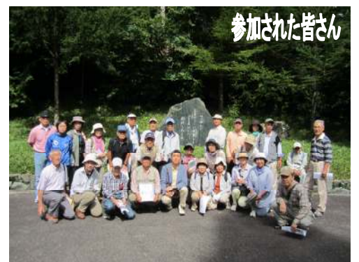
参加された皆さん

先生の解説によりますと、それぞれの碑には色々なドラマが存在いたしますので、これからも、大切に保存伝承して行きたいものです。