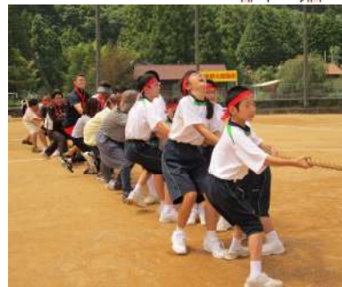
「綱引き」赤組頑張ってます。