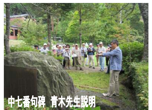
中七番句碑 青木先生説明