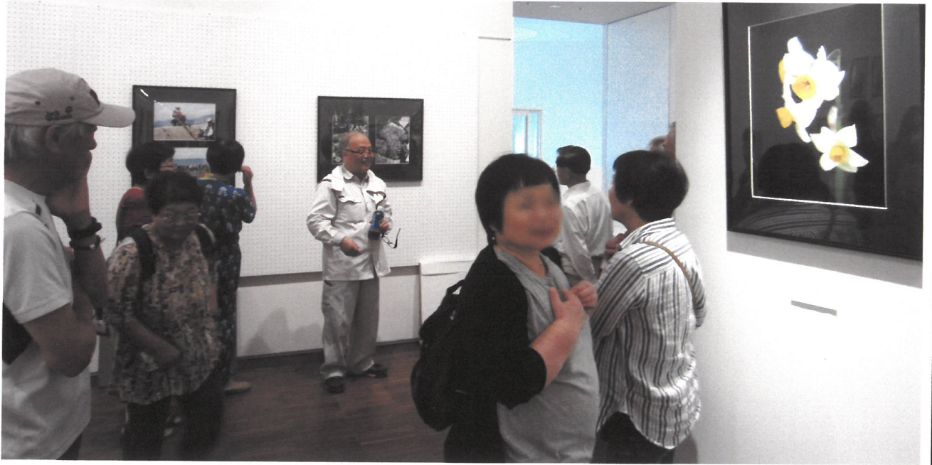
あかがねミュージアム展の一コマ