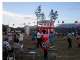
念仏踊り・盆踊り

さて、9月の行事ですが『敬老会』が9月21日（金）に予定されています。対象者の皆様には別途ご案内いたしますので、お誘いあわせの上こそぞってご参加ください。