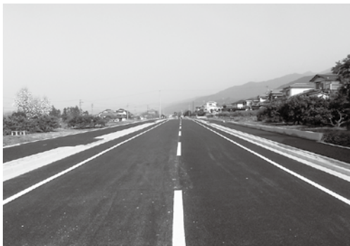
都市計画道路 (上部東西線の一部)

付議事件に関して、これまでの経過と現状、今後の計画などについて、市担当部局から聞き取り調査を行いました。