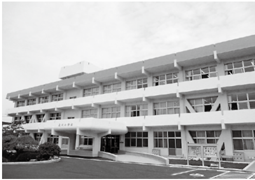
コミュニティ・スクール導入校 (泉川小学校)

7月23日(月)に委員会を開催し、コミュニティ・スクールと小中学校のブロック塀について、市担当部から聞き取り調査を行いました。