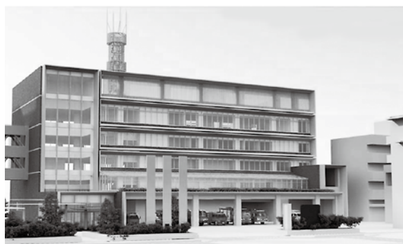
総合防災拠点施設 ※完成イメージ

②大規模災害時における問題 新居浜市の災害対応、豪雨災害におけるため池の防災対策、豪雨災害における鹿森ダム・河川の防災対策、がけ崩れおよび土石流の危険箇所での防災対策、総合防災拠点施設の工事の進捗状況について、市担当部から聞き取り調査を行いました。