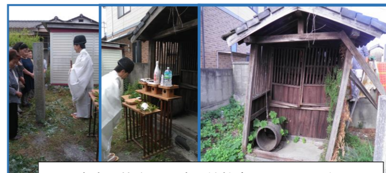
地元有志の皆さんと浦戸神社宮司によるお祓い