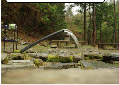
湧き出る：ダイヤモンド水