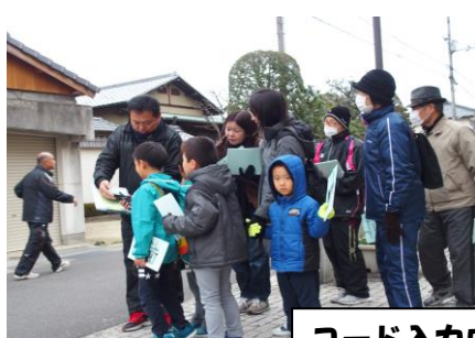
コード入力中 (どこに行くのかな?)