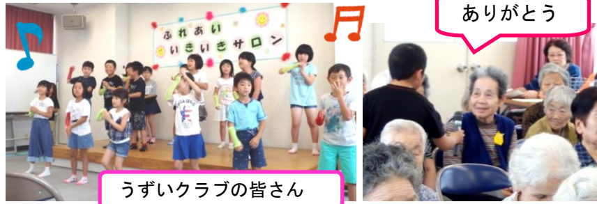
うずいクラブの皆さん