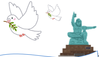
新居浜市立惣開小学校6年生