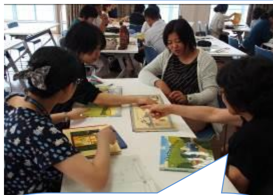
絵本に隠された秘密がそこに! 意図的に仕掛けられた秘密がたくさん!

実際に参加者全員が絵本を変えながら、グループごとに読み聞かせを行いました。声色を変えたり、強弱をつけたり、絶妙に間を空けたりと聞いている人を絵本の世界へと引き込むたくさんの工夫が見られました。さすがは伝えることを仕事としている先生方です。みなさん聞くことにも夢中です!