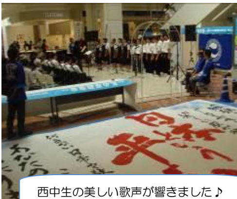
西中生の美しい歌声が響きました♪

本イベントを観覧してくださった方々やイオンモールに買い物にいられた方々に『平和への思い』を書いていただきました。ご協力ありがとうございました。