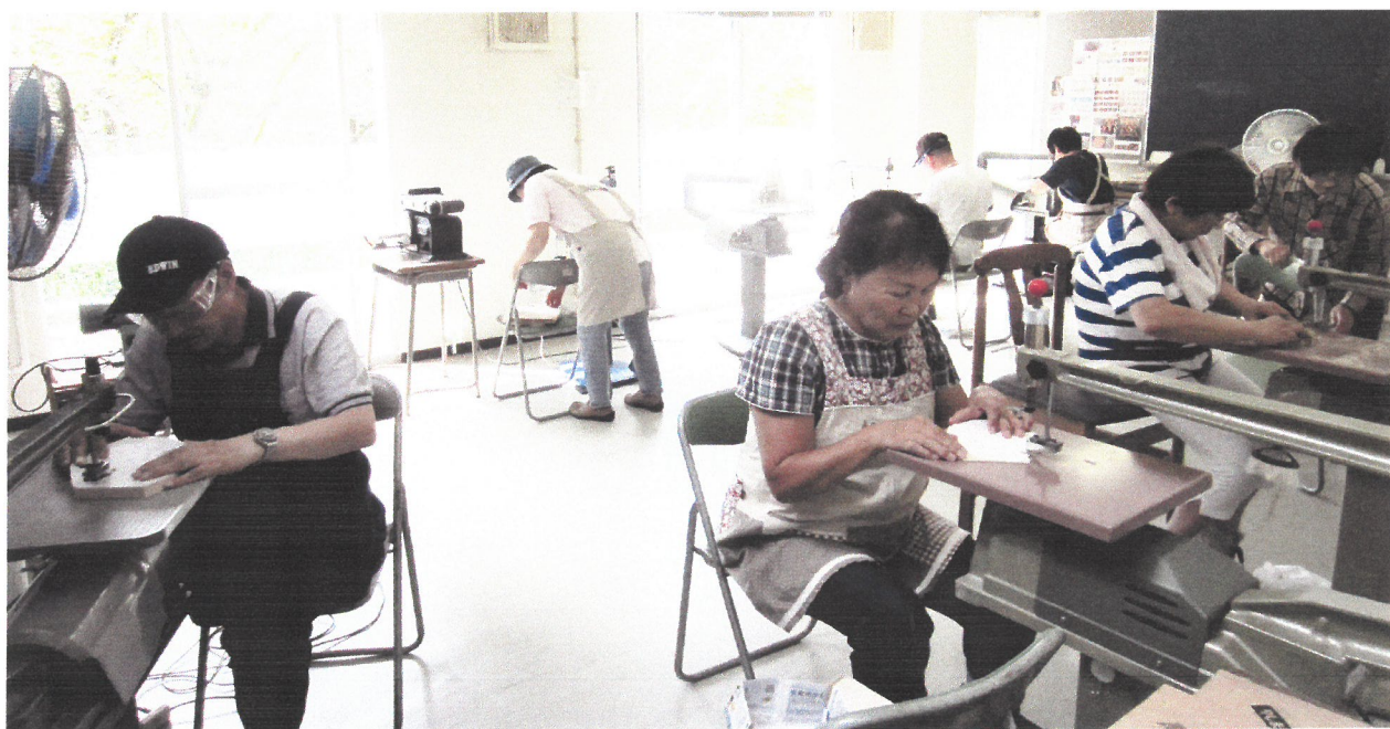
「組み木サークルいとのこ」の活動風景