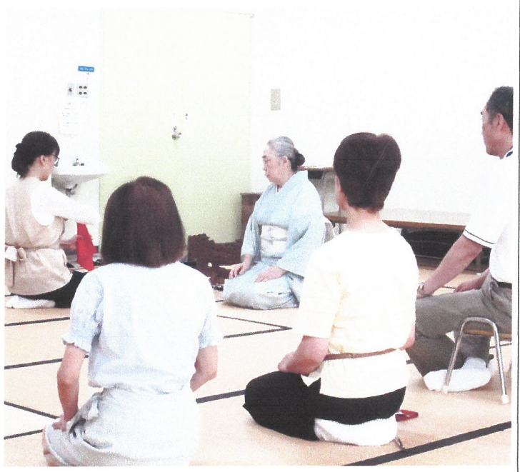
茶道教室の練習風景