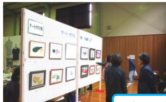
各種団体・サークル展示