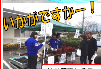
竹炭販売お手伝い