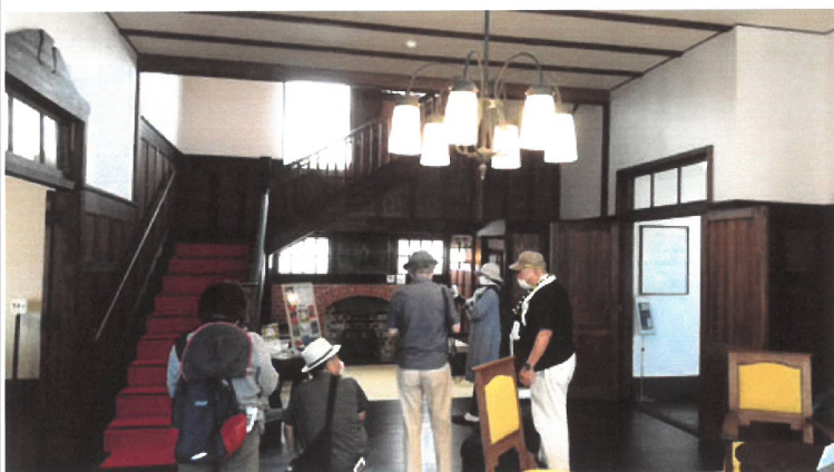
写真教室の活動風景 (於：日暮別邸記念館)