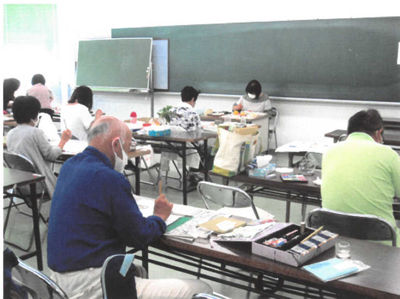
絵手紙教室の活動風景