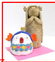
若宮を見守るアマビエ姉妹