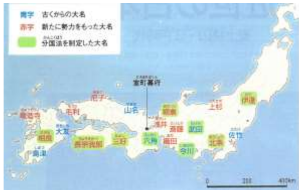
戦国大名 (16世紀ごろ)

今、テレビ大河ドラマで「麒麟がくる」が放映されていますが、その中で一大事件の『本能寺の変』があったのは1582年（天正10）です。また、ドラマにはありませんが、全国統一を目指す豊臣秀吉の命を受けた毛利軍勢とこの新居地方の軍勢との戦い、この地方にとっては前にも後にも無い大きな戦いいわゆる『天正の陣』があったのは、1585年（天正13）で、『本能寺の変』の僅か3年後の出来事です。この二つの事件に焦点をあてて検証してみます。