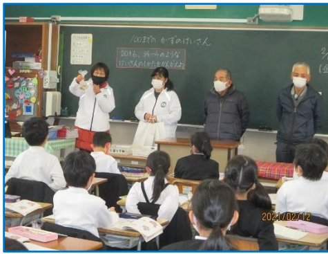
折紙の説明をする地域ボランティア先生たち

毎年「昔遊びと紙飛行機作り教室」で交流していますが、今年はコロナ禍で中止。代わりに若宮こども教室の子どもたちが一緒に「折紙」と「紙飛行機」を準備してくれました(裏面参照)。短い時間でしたが、1年生、2年生の皆さんの歓声を聞くことができうれしかったです。来年はぜひ一緒に折ったり、遊んだりして楽しく交流したいですね!