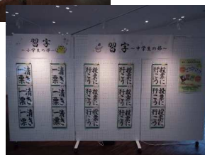
昨年度の作品展の様子（あかがねミュージアム）