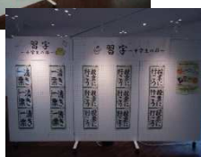
さくねんと さくひんてん しょうす 昨年度の作品展の様子 (あかがねミュージアム)