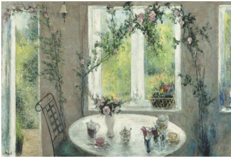
《バラ咲くハーブスタンド》2018年