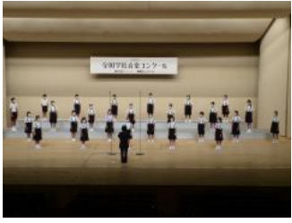
高津小合唱部の皆さん

第88回NHK全国学校音楽コンクール愛媛県大会が8月5日(木)、6日(金)に松山市民会館で開催され、高津小学校・東中学校共に見事金賞を受賞されました。おめでとうございませう。 新型コロナウイルス感染症対策のため、今年は東予地区大会の開催は見送られ、全会場無観客と異例の開催となりましたが、感染対策を怠らず努力を重ね、当日は実力を十分発揮され金賞を受賞され、本当に素晴らしいです。高津小学校合唱部と東中学校音楽部の皆さんは、9月25日(土)から愛媛県民文化会館で開催される四国ブロック大会に臨まれます。 地域のみならず応援しています。頑張ってください。