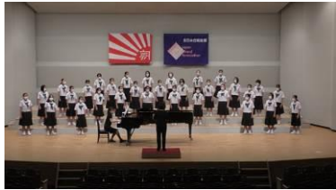
東中音楽部の皆さん