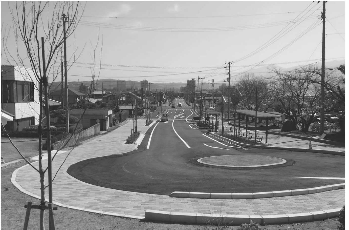
滝の宮公園エントランス