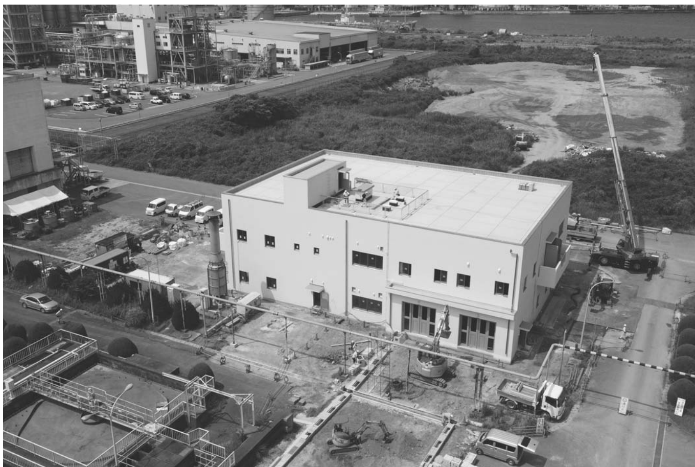
下水処理場敷地内に建設中のし尿・浄化槽汚泥受け入れを行う汚泥共同処理施設