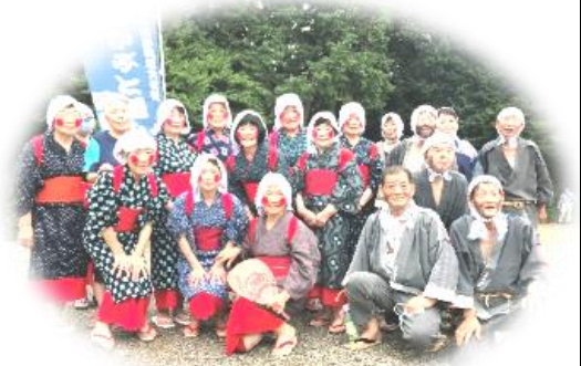
かぶと踊り保存会の皆さん