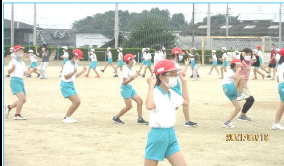
最初は恥ずかしそうでしたが、だんだん調子がでていい踊りになりました。運動会でも頑張ってるね。

9月16日(木)、かぶと踊り保存会による「かぶと踊り教室」が開かれました。雨乞いの太鼓に合わせて踊る「かぶと踊り」は船木に古くから伝わる郷土芸能です。保存会の皆さんによって次世代に継承され、毎年運動会などで披露されています。保存会の皆さんは、船中にも出向いて教えてくれています。