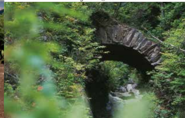
旧别子铜山地区 the 80th anniversary prize 2017 Akagane Photo Contest Winning Works