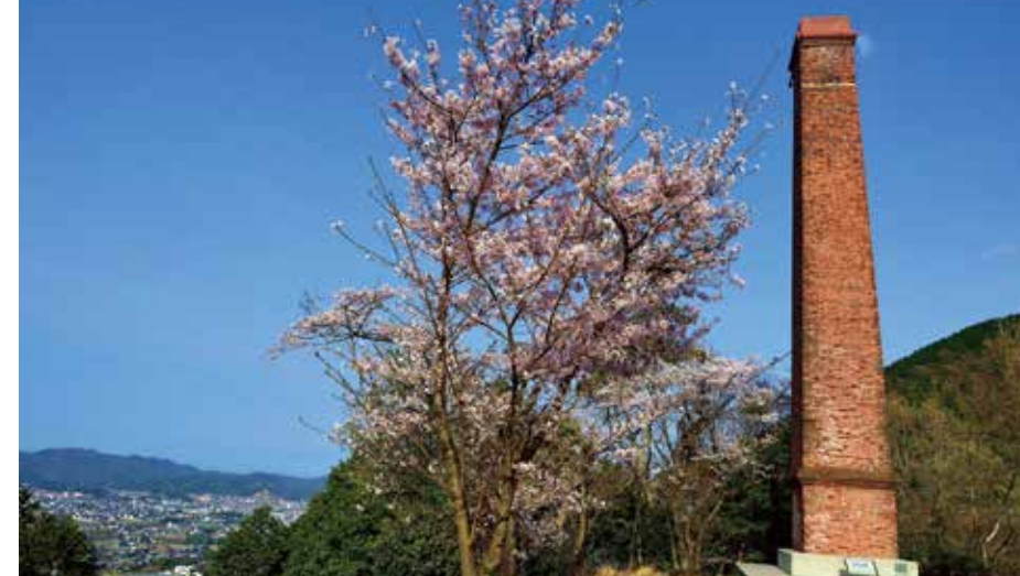
旧山根冶炼厂烟囱