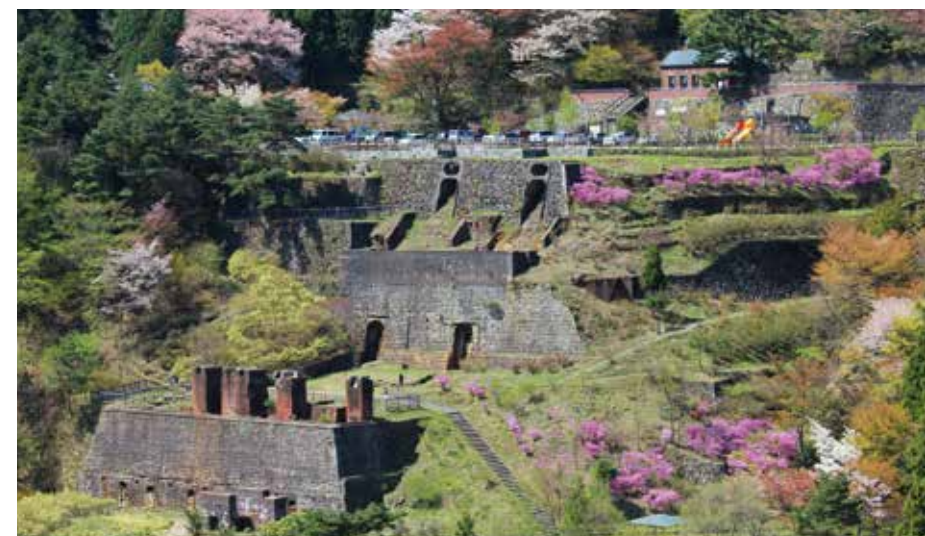
别子矿藏公园 东平地区