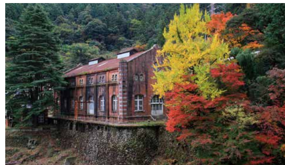
旧端出场水力发电站