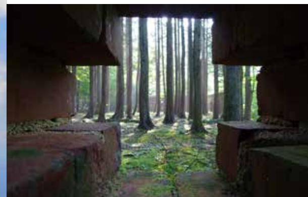
旧别子铜山地区 the first prize 2017 Akagane Photo Contest Winning Works