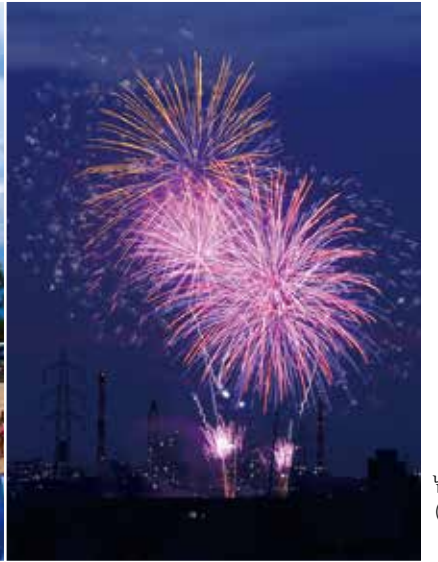
남량 불꽃놀이 (7월)