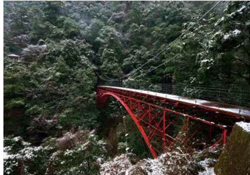
오도시바시 (오도시 다리)