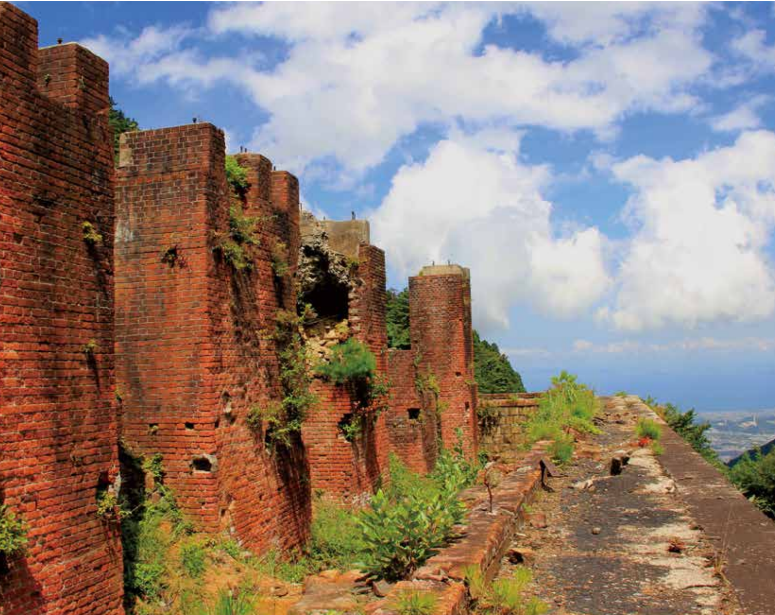
마인도피아 벤티 도나루존