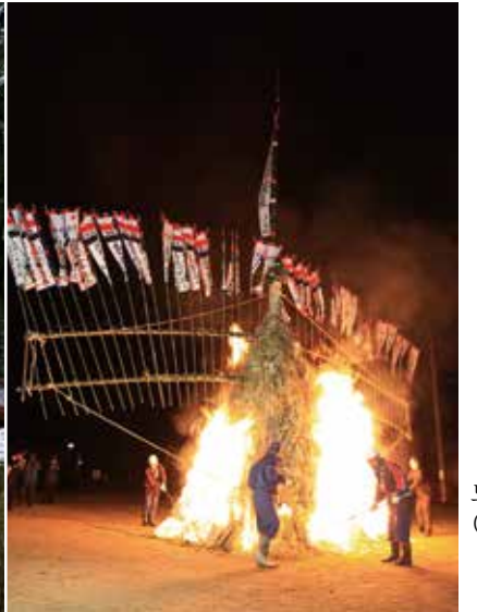
도우도 오쿠리 (1월)