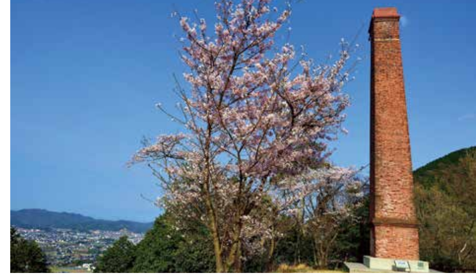
구 야마네 제련소 굴뚝

겐로쿠 4년 개갱 때 1200m의 산속에서 채굴하기 시작한 벤티동산. 283년 후 (소화 48년) 폐산 때는 해면 1000m까지 파들어 갔습니다. 그때에 산출된 동의 양은 65만톤에 달하는 일본 굴지의 동산입니다.