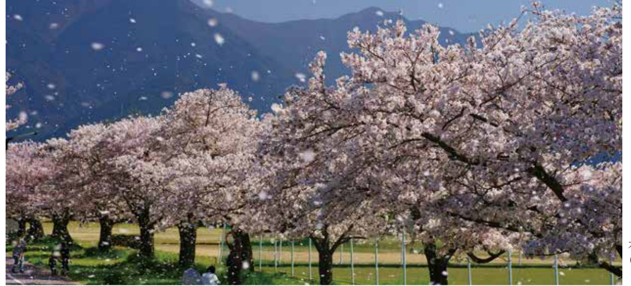
가센지기 공원 (봄)