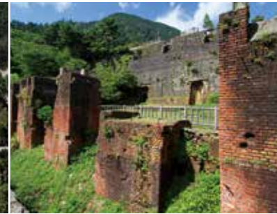
마인도피아 벤티 도나루촌