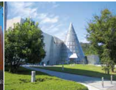
니이하마시 종합과학 박물관