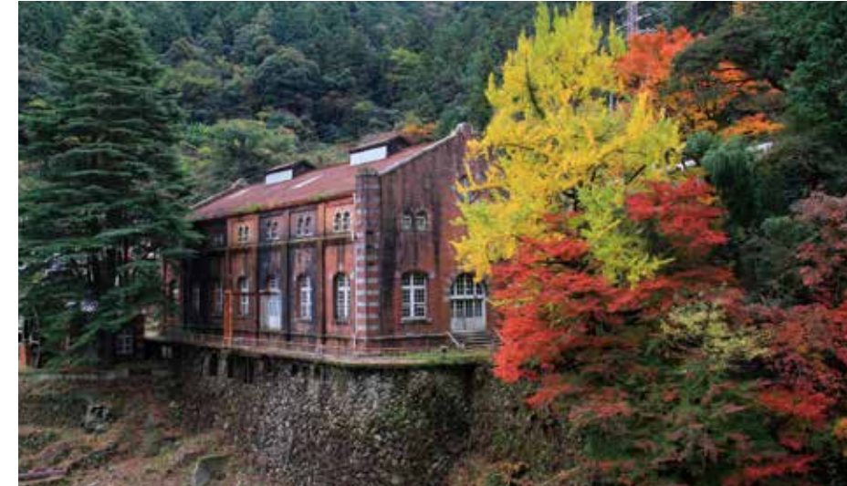
구 하데바 수력 발전소