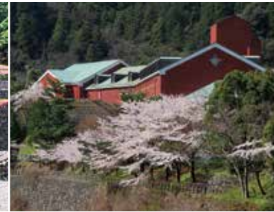
마인도피아 벤티 하데바 촌