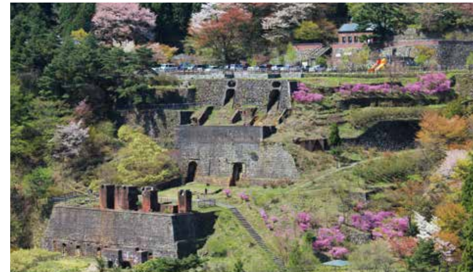
마인도피아 벤티 도나루존