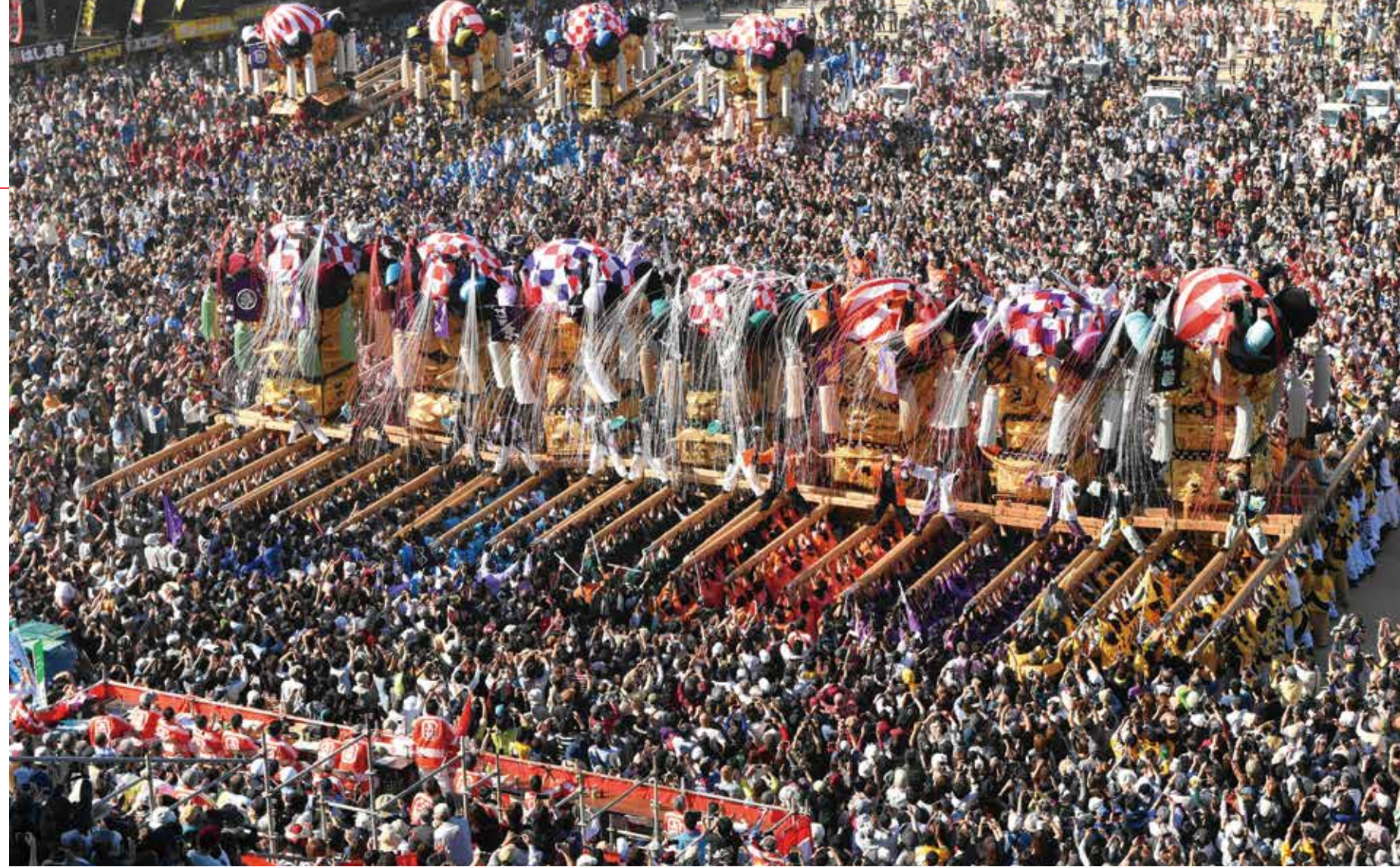
야마네 그라운드 「가키쿠라베」

매년 10월에 열리는 니하마 큰북 축제는 시코쿠 3대 축제 중의 하나로 꼽히며 전국에 자랑하는 전통문화 행사입니다. 금실로 자수한 호화 현란한 후톤지메나 막을 단 큰북 가마는 높이 약 5.5미터, 길이 약 12미터, 폭은 약 3.4미터, 무게 약 3톤이며, 약 150인의 「가키후」라고 불리는 남자들이 짊어집니다. 최대의 볼거리는 여러 대의 큰북 가마가 나란히 옆으로 줄지어 서면, 가키후의 힘만으로 높이 들어 올리는 「가키쿠라베」로 관중과 하나가 되어 최고조에 이릅니다.