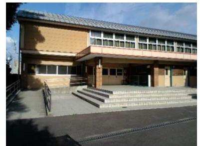
【06号の答】「金栄小学校体育館」でした。

大変遅ればせながら、今年もよろしくお願ひします。3学期が始まったと思ったら、もうそろそろ中盤に差し掛かるころ。昔、「1月はいく、2月は逃げる、3月は去る。」、つまり3学期はあっという間なので毎日を大切に過ごすように言われたものですが、ほんとその通りだと今更ながら思う今日この頃です。（うさぎ）