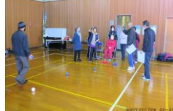
スポーツ健康教室 (ポッチャ)