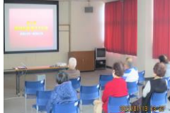
高齢者いきいきセミナー (映画上映会)