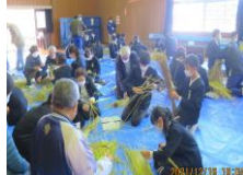
三世代交流事業 (しめ縄作り)