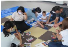
子育て支援セミナー (メルヘンクラブ)