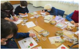
くらしのセミナー (グラスアート)