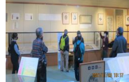
郷土の歴史と文化 (近藤篤山の孝道を訪ねて)