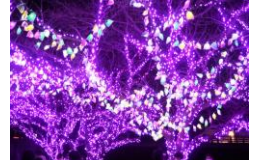
大生院校区まちづくり事業 (イルミネーション点灯)