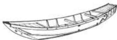
てんません「伝馬船」