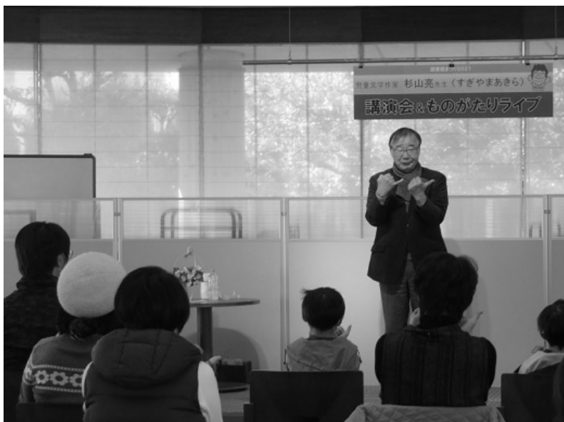
(児童作家『杉山亮講演会 &物語ライブ』)