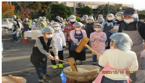
三世代交流もちつき大会