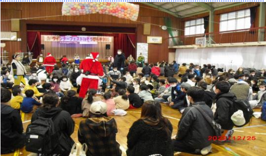
ウインターフェスト in そうびらき2022