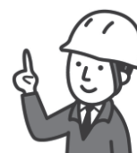
新居浜市内における事故件数