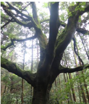
榎の木(学校跡にある)